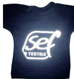
Trägerfolie abziehen, fertig!

Mit einer Retroreflektion von 500 cd/lux.m 2 ist ReflexCut HT FR nach EN ISO 20471 zertifiziert. Die Flammhemmung ist zertifiziert nach EN ISO 11612, EN ISO 14116 und EN ISO 15614.